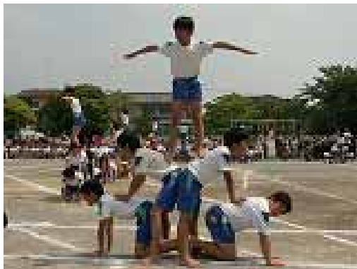
桜の木が、だんだん大きくなって...

桜並木の写真展、桜についての講話等で、桜並木や環境問題に強い関心を持った5・6年児童が、5月30日の同校運動会で“さくら”をテーマにした“組み体操”を演じ、観客の感動を呼びました。