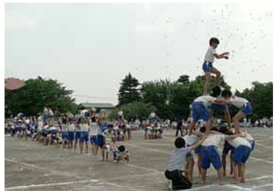
花吹雪を散らしています